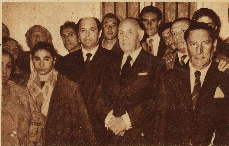
El hermano y el hijo de Manuel Torre—derecha de la fotografa—con el alcalde de Jerez, Sr. Garca Figueras, y destacadas figuras del cante jondo que asistieron al descubrimiento de la placa en la casa donde naci, en Jerez de la Frontera, el cebre cantaor. (Fotos Archivo Flamencologa.)

Director de la Seccin de Flamencologa del Centro Cultural Jerezano.